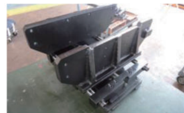
二輪車タイヤクランプ治具 2枚の板で後輪を挟み、 二輪車を立てた位置で保持します。