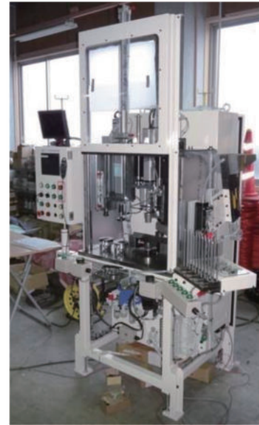
二輪車VVTスプロケット組立装置