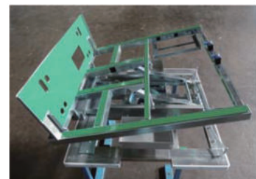
住設機器組立治具パレット 工程に合わせて角度調整が可能です。