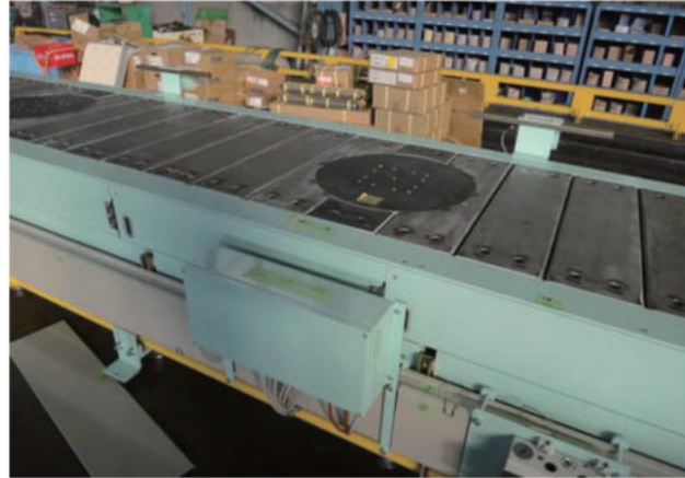
エンジン組立ライン(スラットCV内埋め込み、組立方向変換)