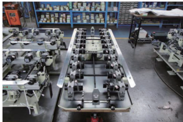
トランスミッション検査出荷ライン(搬送方向変換用、通路確保用)