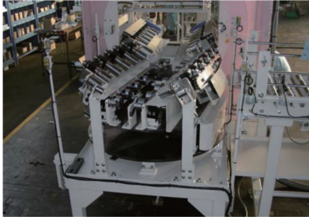
シリンダブロック搬送ライン(直列型・V型混流、搬送方向変換)