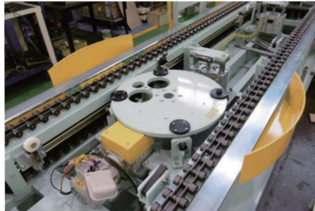
エンジン完成テストライン(外観検査、荷重950kg)