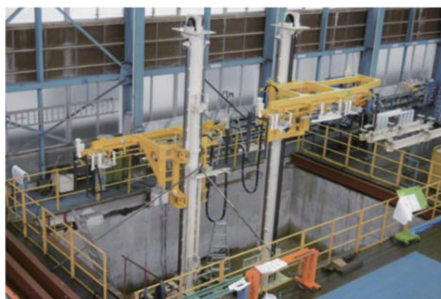
積み込みリフト(揚程4360、全高8150)