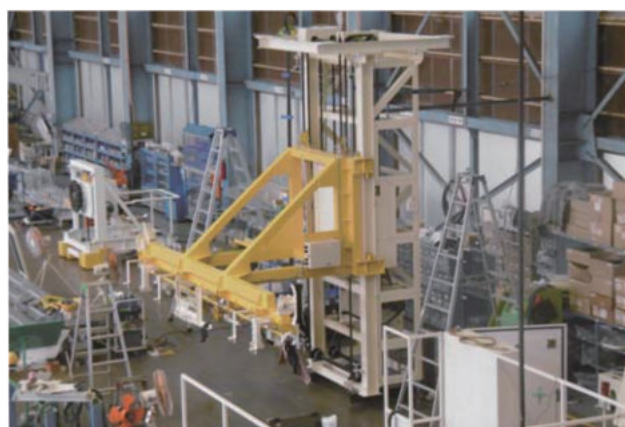
搬送レベル変更リフト(天吊り型)