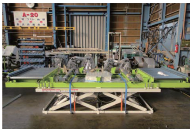
二輪車出荷用梱包ライン(油圧テーブルリフト)