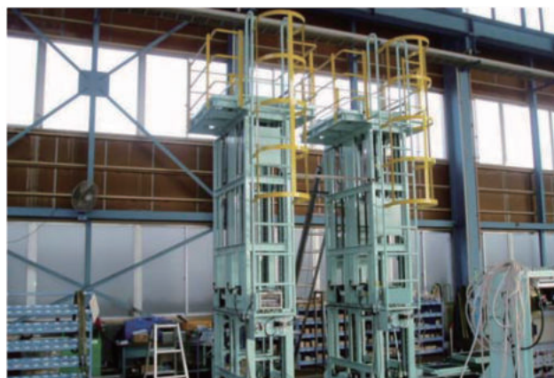
シリンダブロック垂直ストック装置