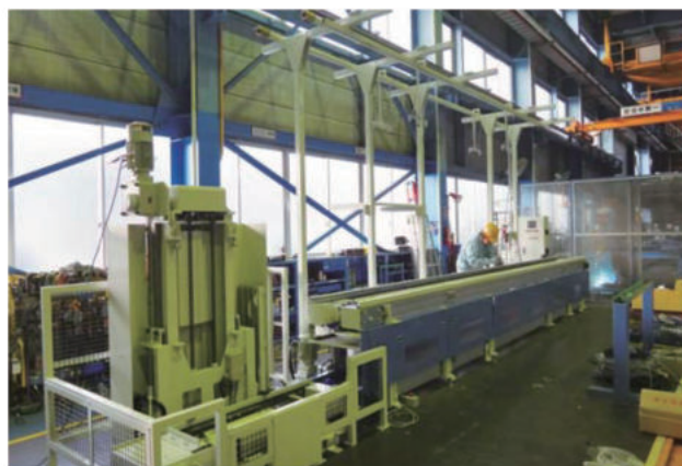
エンジン検査ライン (2層コンベヤ端末リフト、サイドプランジャ方式)